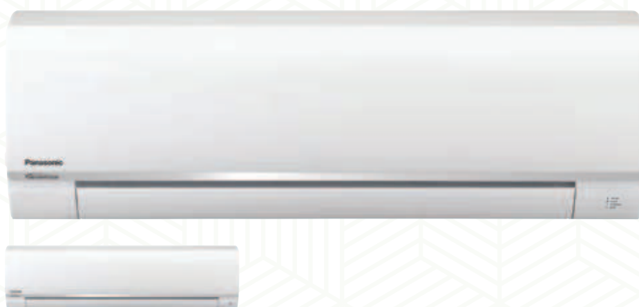
CS-RE18RKEW // CS-RE24RKEW