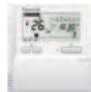
Volitelný ovladač Dálkový ovladač s časovačem CZ-RTC4