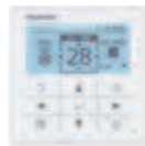
Volitelný ovladač Napevno zapojený dálkový ovladač CZ-RTC5