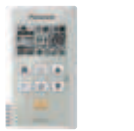
Volitelný ovladač Zjednodušený dálkový ovladač CZ-RE2C2