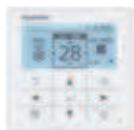
Volitelný ovladač Napevno zapojený dálkový ovladač CZ-RTC5