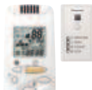
Volitelný ovladač Bezdrátový dálkový ovladač CZ-RWSC2 + CZ-RWSC3