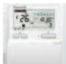
Volitelný ovladač Dálkový ovladač s časovačem CZ-RTC4